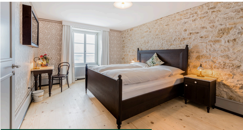
Superior Doppelzimmer Nostalgie